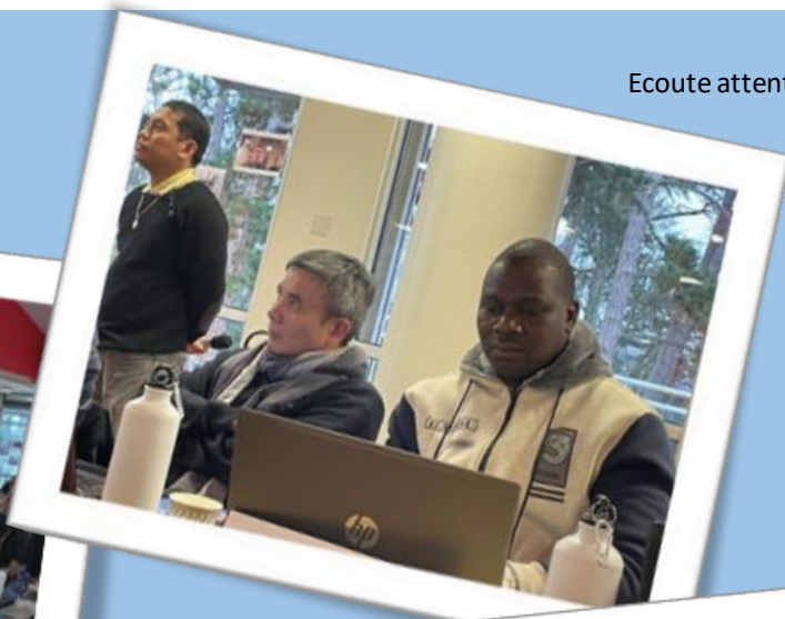
Chapitre hors les murs.