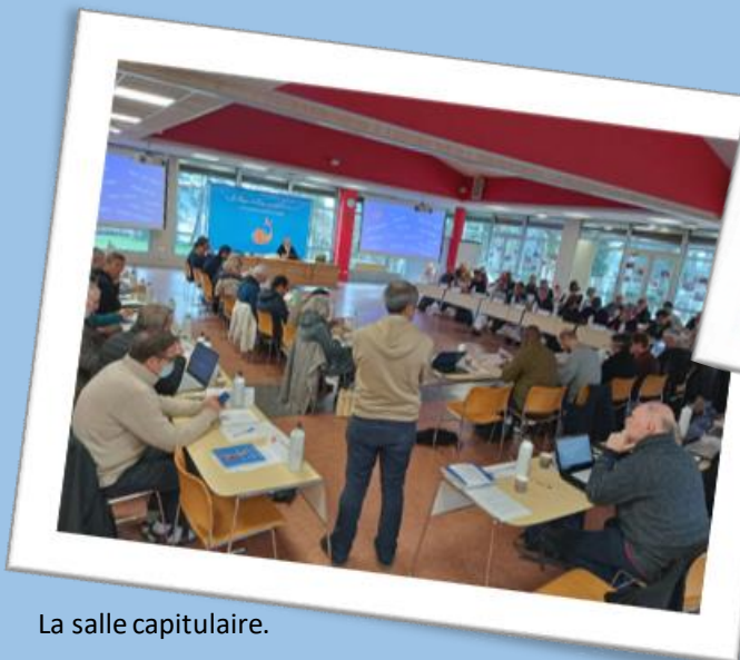
La salle capitulaire.