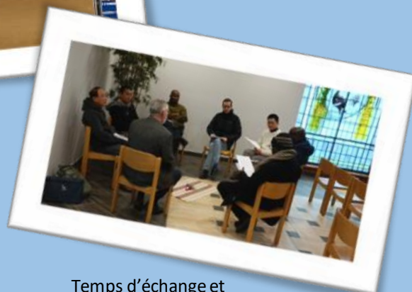
Temps d'échange et partage à l'oratoire.