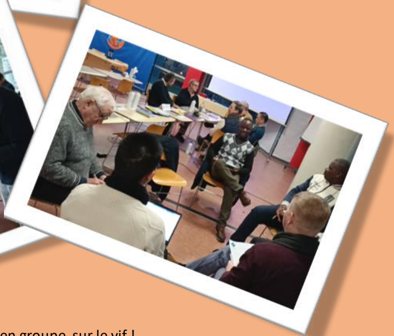
Travaux en groupe, sur le vif !