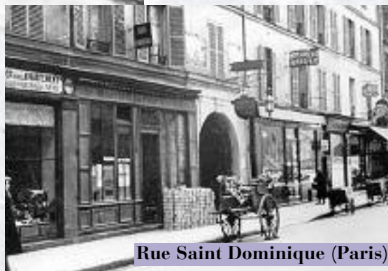
Rue Saint Dominique (Paris)