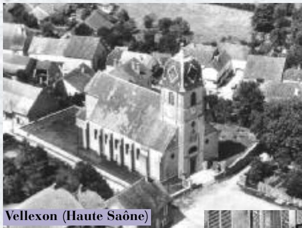
Vellexon (Haute Saône)

Les chemins vocationnels d'Étienne Pernet et d'Antoinette Fage sont aussi bien différents. Pour Étienne l'appel a été précoce, dès les années de catéchisme avec une ligne droite jusqu'à la dernière année de séminaire. Tandis qu'Antoinette, naturellement donnée aux autres avec une fouguese générosité, semble ne s'être vraiment posé la question de l'orientation de sa vie qu'à l'âge de 40 ans.