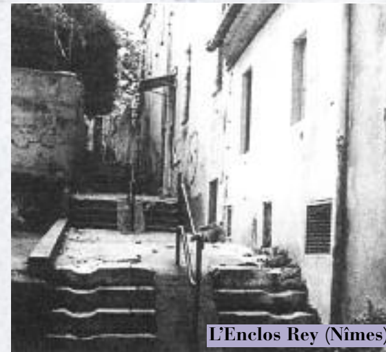
L'Enclos Rey (Nîmes)

En mai 1865, il lui offrit de l'aider à réaliser l'œuvre qu'il venait d'entreprendre : venir en aide aux familles ouvrières soumises à un travail dur, souvent mal logées. Car le projet entrevu à Nîmes dans le quartier pauvre de l'Enclos Rey lui avait donné des ailes, sa vie avait pris un sens, et