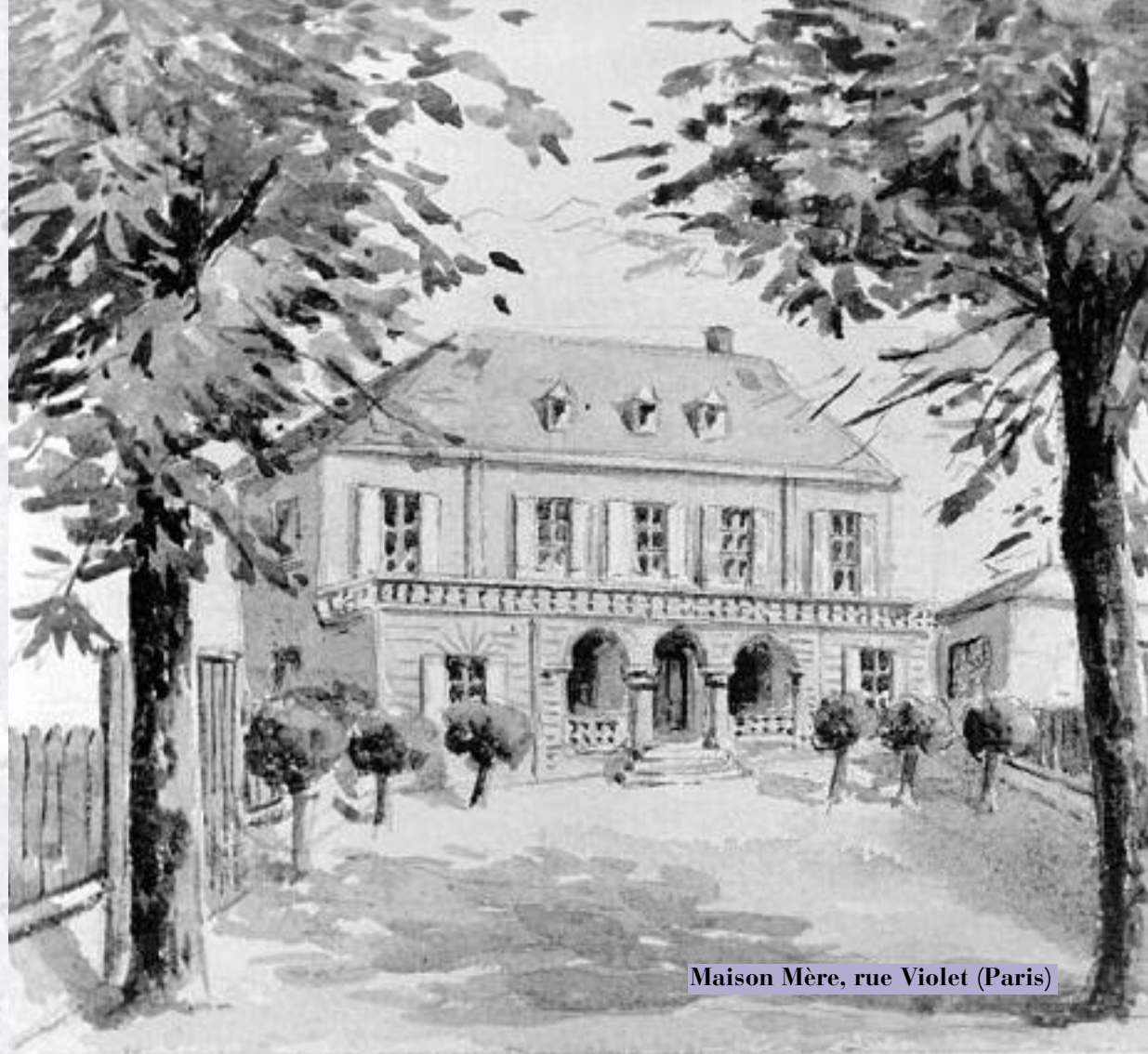
Maison Mère, rue Violet (Paris)

La Congrégation avait dès lors pris sa vitesse de croisière. Comme la semence dont parle Jésus, elle va se développer au cours des années, « on ne sait comment. »