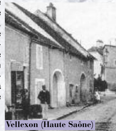
Vellexon (Haute Saône)