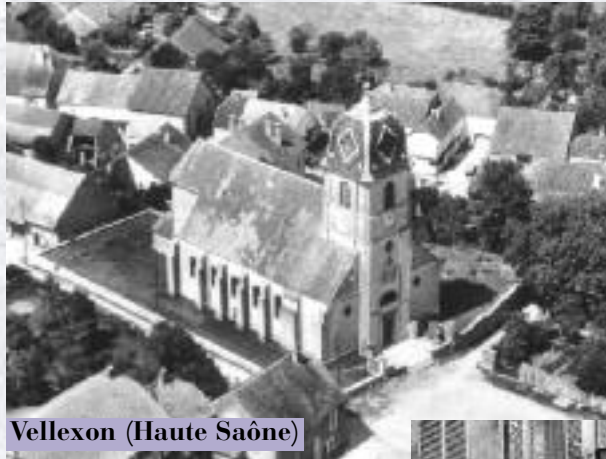
Vellexon (Haute Saône)

Les chemins vocationnels d'Étienne Pernet et d'Antoinette Fage sont aussi bien différents. Pour Étienne l'appel a été précoce, dès les années de catéchisme avec une ligne droite jusqu'à la dernière année de séminaire. Tandis qu'Antoinette, naturellement donnée aux autres avec une fouguese générosité, semble ne s'être vraiment posé la question de l'orientation de sa vie qu'à l'âge de 40 ans.