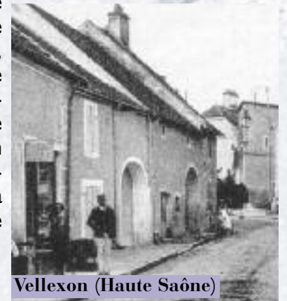
Vellexon (Haute Saône)